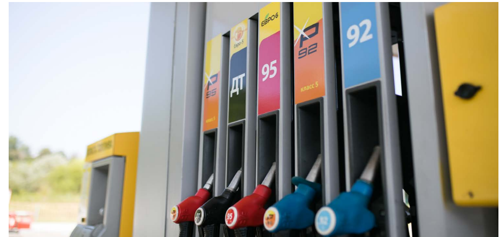
Продажи высокооктанового бензина «Евро-6» стартовали в 2018 году в Республике Башкортостан и в Краснодарском крае.