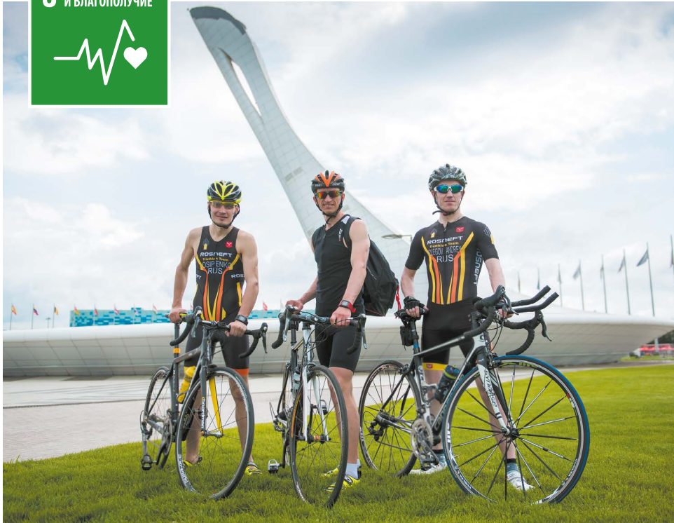
В 2018 году 25 тыс. работников из 92 Обществ Группы приняли участие в ежегодных Спартакиадах ПАО «НК «Роснефть».