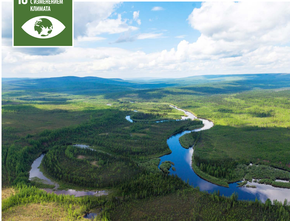
Красноярский край, Восточная Сибирь. В 2018 году Общества Группы высадили около 1 млн саженцев в рамках мероприятий по сохранению лесов.