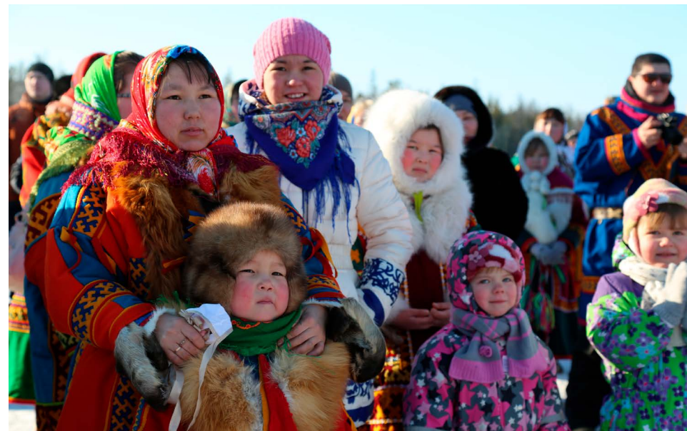
«Роснефть» выступает спонсором и организатором экологического форума «ЭКОАРКТИКА» для обсуждения состояния природных систем Арктики, экологической безопасности, сохранения традиционного уклада жизни коренных малочисленных народов Севера и других актуальных вопросов. В 2019 году Форум состоялся в Республике Саха (Якутия).