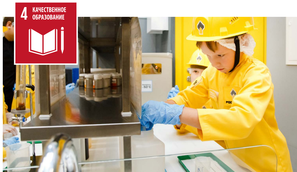
«Роснефть» и детский образовательно-игровой парк «Кидзания» провели экскурсию для детей из реабилитационных центров и детских домов.