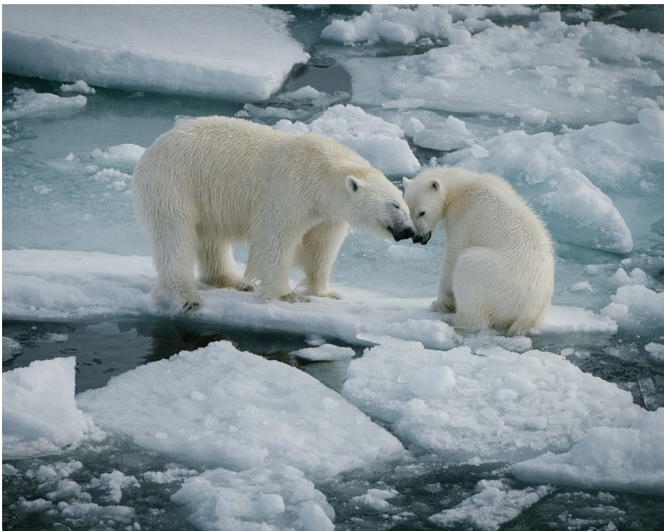
«Роснефть» ежегодно проводит исследования белых медведей Арктики. Также под опекой Компании находятся все особи белых медведей, содержащиеся в зоопарках России.