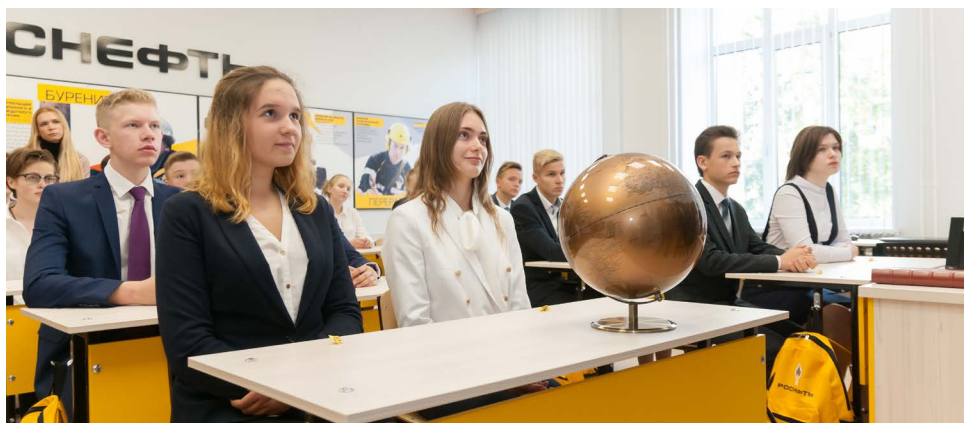
Проект «Роснефть-класс»: от школы до предприятия – один из стратегических и важных проектов Компании. В 2018 году в 52 Общества Группы трудоустроились 678 выпускников «Роснефть-классов», получивших профильное высшее образование.