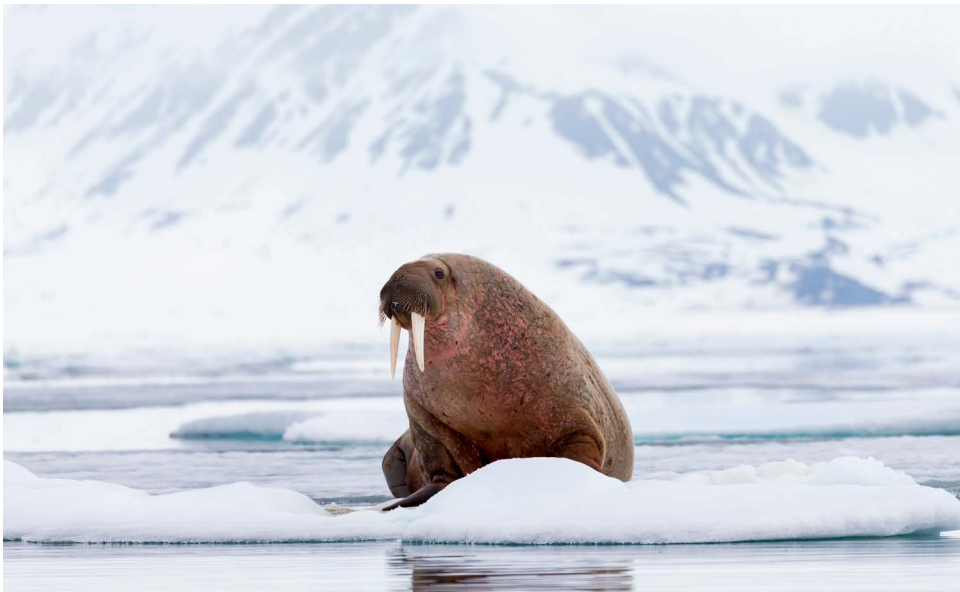
Компания регулярно проводит научно-исследовательские экспедиции по изучению состояния морских арктических экосистем, особое внимание уделяя морским млекопитающим, в том числе моржам.